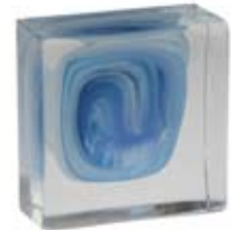
BIANCO & CELESTE WHITE & SKY BLUE 603