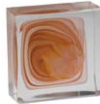
BIANCO & AMBRA WHITE & AMBER 607