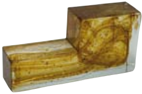
ELLE SX Elle Left Elle Gauche L-förmiger Glasstein links