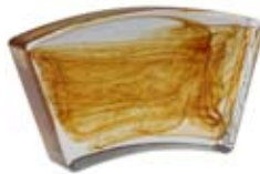
1/10 COLONNA DIAMETRO 80 CM 1/10 Column diameter 80 cm 1/10 Colonne diamètre 80 cm 1/10 Säule Durchm.80 cm