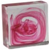
ROSA PINK 002