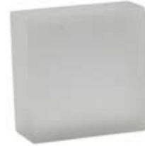
FINITURA OPALINE FINISH OPALINE CP ACID