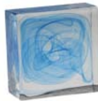
CELESTE BLUE 003