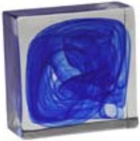
BLU BLUE 005