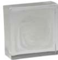
BIANCO WHITE 606