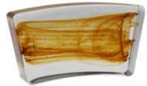
1/16 COLONNA DIAMETRO 120 CM 1/16 Column diameter 120 cm 1/16 Colonne diamètre 120 cm 1/16 Säule Durchm.120 cm