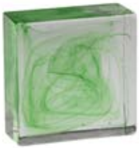
VERDE GREEN 001