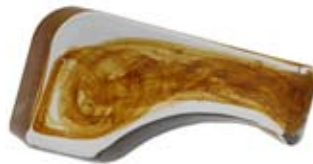
COLONNA QUADRA SX Squared Column Left Colonne Carrée Gauche Rechtech.Säule links