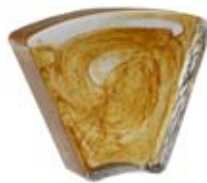
1/8 COLONNA DIAMETRO 40 CM 1/8 Column diameter 40 cm 1/8 Colonne diamètre 40 cm 1/8 Säule Durchm.40 cm