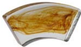
1/6 COLONNA DIAMETRO 60 CM 1/6 Column diameter 60 cm 1/6 Colonne diamètre 60 cm 1/6 Säule Durchm.60 cm