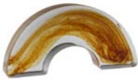
1/2 COLONNA DIAMETRO 28 CM 1/2 Column diameter 28 cm 1/2 Colonne diamètre 28 cm 1/2 Säule Durchm.28 cm