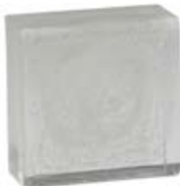
BIANCO & SILVER WHITE & SILVER 5.006