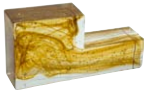
ELLE DX Elle Right Elle Droite L-förmiger Glasstein rechts