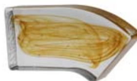
ANGOLARE SX Cornerbrick Left Angle Gauche Eckstein links