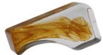
COLONNA QUADRA DX Squared Column Right Colonne Carrée Droite Rechtech.Säule rechts