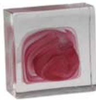
BIANCO & ROSA WHITE & PINK 602