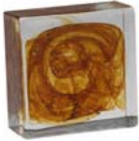
AMBRA AMBER 007