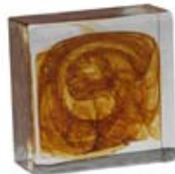
MEZZO MATTONE Half Brick Demi Brique Halb-Glasstein