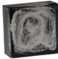
FINITURA SILVERSTAR FINISH SILVERSTAR 5.004