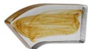
ANGOLARE DX Cornerbrick Right Angle droit Eckstein rechts