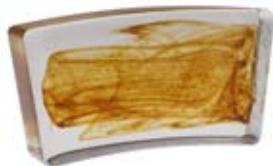
1/22 COLONNA DIAMETRO 180 CM 1/22 Column diameter 180 cm 1/22 Colonne diamètre 180 cm 1/22 Säule Durchm.180 cm