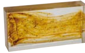
MATTONE Glass Brick Brique Entière Glasstein