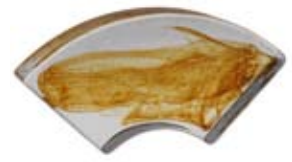
1/4 COLONNA DIAMETRO 40 CM 1/4 Column diameter 40 cm 1/4 Colonne diamètre 40 cm 1/4 Säule Durchm.40 cm