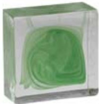
BIANCO & VERDE WHITE & GREEN 601