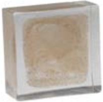
BIANCO & GOLD WHITE & GOLD 5.005