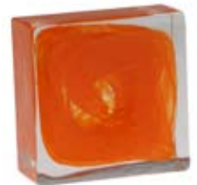
ARANCIO ORANGE 008