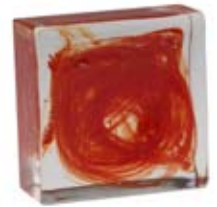
ROSSO RED 004