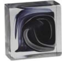
BIANCO & BLU COBALTO WHITE & COBALT BLUE 609