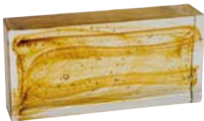
MATTONE Glass Brick Brique Entière Glasstein