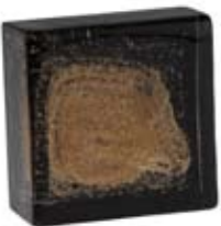
FINITURA GOLDSTAR FINISH GOLDSTAR 5.003